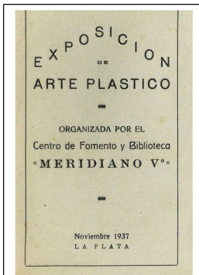
Gonino, E. Catálogo de la Primera Muestra. Archivo del Artista.