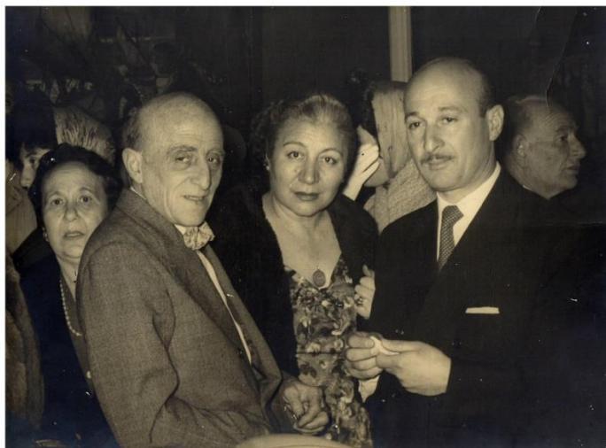
Gonino, E. Con Quinquela.